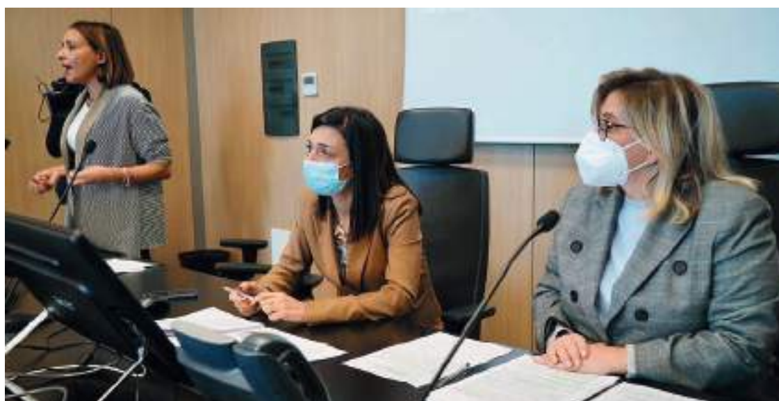
La presentazione del programma regionale "Puglia Capitale Sociale 3.0" a favore del Terzo Settore