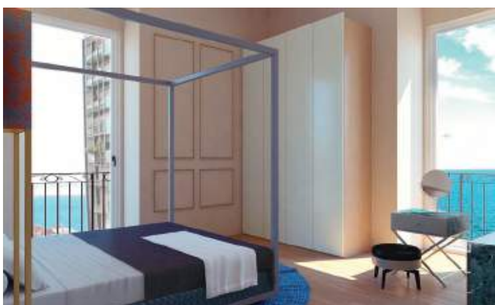
In alto: la facciata esterna della palazzina di tre piani in viale Virgilio, a Taranto, recuperato e valorizzato dalla CO.RE.T.; sopra: render interno